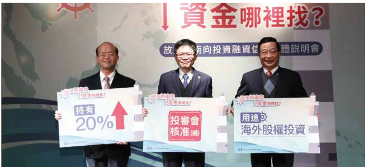
臺灣中小企業銀行黃董事長（左）、兆豐銀行張董事長（右）及本基金蔡董事長（中）出席「放寬新南向投資融資信用保證說明會」