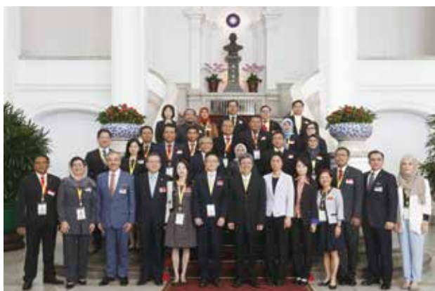
各會員機構與會代表與陳副總統合影（二）