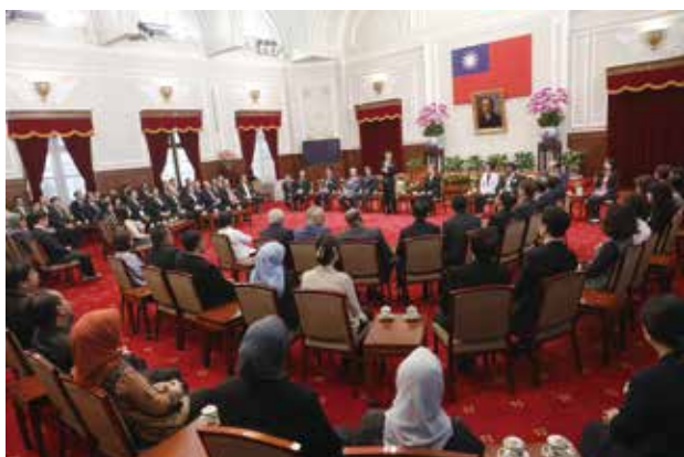
各會員機構與會代表參訪總統府，承陳副總統接見

年會期間亦安排參訪總統府，並承陳副總統建仁接見 ACSIC 各國代表。除歡迎各國代表蒞臨台灣及祝賀 ACSIC 30 週年外，副總統也期盼藉由 ACSIC 會員機構間的交流，強化各國中小企業融資之基礎，並促進與新南向各國的合作。