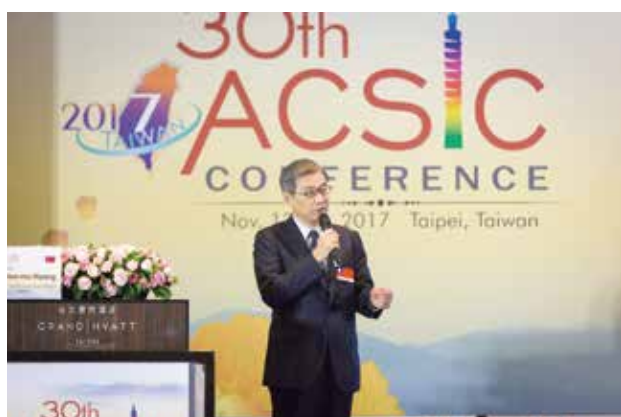
貴賓演講：金管會黃副主委

106 年適逢 ACSIC 成立 30 週年，年會特以「ACSIC 30 週年：信用補充制度之成就及未來展望」為研討主題，由會員國家分享其經驗及作法；並由金管會黃副主委天牧及中小企業處蘇副處長文玲擔任演講貴賓，分別以「我國金融創新及普惠金融」及「我國中小企業發展政策及融資輔導」為題發表演講。