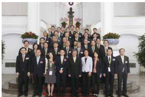
各會員機構與會代表與陳副總統合影（三）