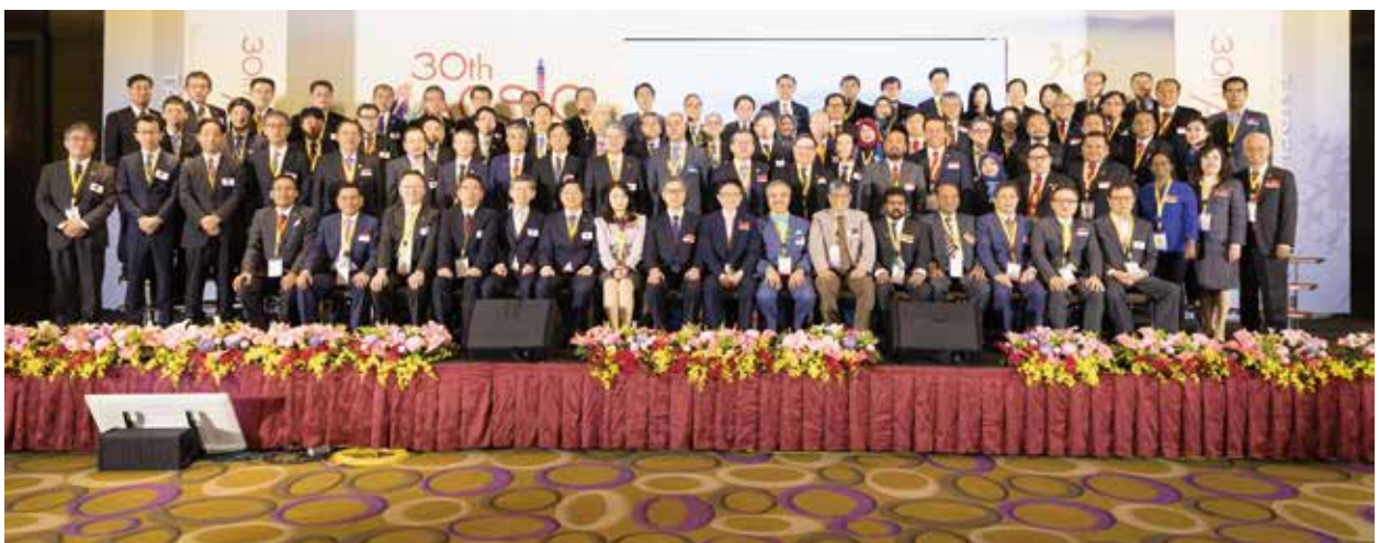
ACSIC 第 30 屆年會之與會貴賓及全體代表