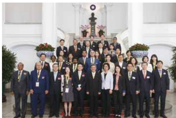
各會員機構與會代表與陳副總統合影（一）