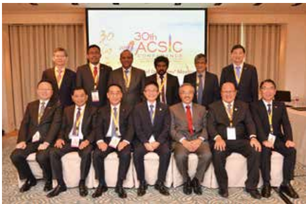
與會會員機構領隊

ACSIC 第 30 屆年會於 106 年 11 月 13 日至 17 日在台北君悅酒店舉行，亞洲各國信用補充機構首長、主要幹部、歐盟的信用補充機構代表及國內各大金融機構高階主管約 110 人出席會議。本屆年會由本基金主辦，與會之會員國家中除 7 個是新南向政策的國家外，與往年不同的是，特地邀請非會員國但亦為新南向國家的柬埔寨與會。此外並邀請本國金融機構，藉此深化合作，並連結金融機構與各國代表對談，深入了解新南向國家之商機與挑戰。