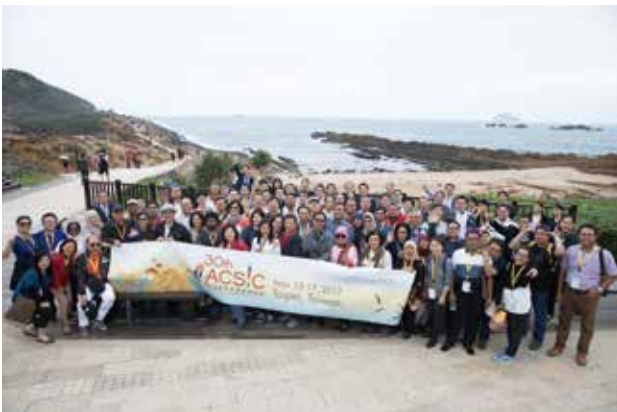
全體代表參訪野柳地質公園

除會議外，本屆年會並安排各與會代表參訪野柳地質公園，欣賞野柳獨特地質景觀；參訪國立故宮博物院，親身感受歷史文化之美。