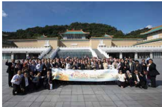
全體代表參訪故宮博物院