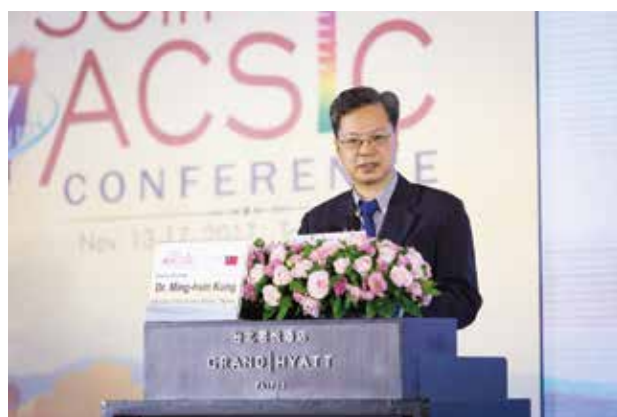
經濟部龔次長於開幕式致詞